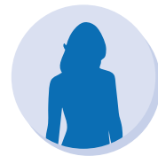
50代女性 疾患：統合失調症

LINE の定期配信の質問で「 残薬あり 」だったため、お電話で本人に連絡し残薬調整できる旨を説明。その後、処方時患者様自身で医師に申し出て 残薬が解消した 。