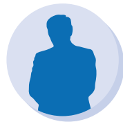
60代男性 疾患：糖尿病